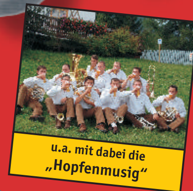
u.a. mit dabei die „Hopfenmusik“

3 palchi • 14 gruppi musicali • 12 chioschi divertimento per bambini